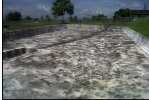
Gambar 3. Pengapuran kolam

mengendapkan butiran lumpur halus, memperbaiki kualitas tanah, dan kapur yang berlebihan dapat mengikat fosfat yang sangat dibutuhkan untuk pertumbuhan plankton. Perhitungan kebutuhan kapur yaitu dengan mengalikan luasan kolam dengan dosis yang digunakan. Jumlah kapur yang digunakan untuk kolam seluas 400 m 2 adalah 20 kg.