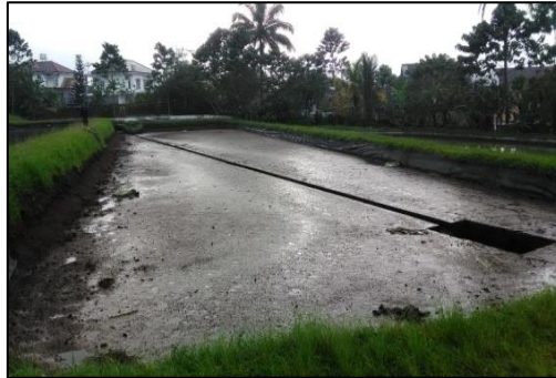
Gambar 2. Pengeringan kolam pemeliharaan

Pengeringan kolam (Gambar 2) dilakukan pada hari pertama. Menurut Arie (2012), tujuan kegiatan ini membasmi hama dan penyakit, menghilangkan senyawa atau gas beracun, mempercepat proses menetralsir dari sisa organik dan memperbaiki struktur tanah menjadi gembur, mengurangi kadar air yang terkandung dalam lumpur supaya memudahkan dalam perbaikan kolam dan dasar kolam.