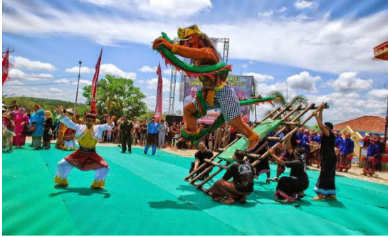
Gambar: Ilustrasi Radin Jambat dalam Festival Radin Jambat di Kabupaten Way kanan

Legenda merupakan salah satu jenis karya sastra lama, yang keberadaannya semakin ditinggalkan masyarakat. Khususnya legenda Radin Djambat dipandang perlu untuk dijadikan bahan kajian dengan harapan dapat memahami nilai-nilai filosofi yang terkandung di dalamnya. Meskipun legenda Radin Djambat ini bersifat fiksi, isi ceritanya menyajikan objek dan menimbulkan daya khayal atau pengalaman melalui kesan-kesan imajinatif. Di dalamnya juga berisi tentang potret kehidupan manusia, terutama dalam bentuk perjuangan, persahabatan, dan keagamaan.