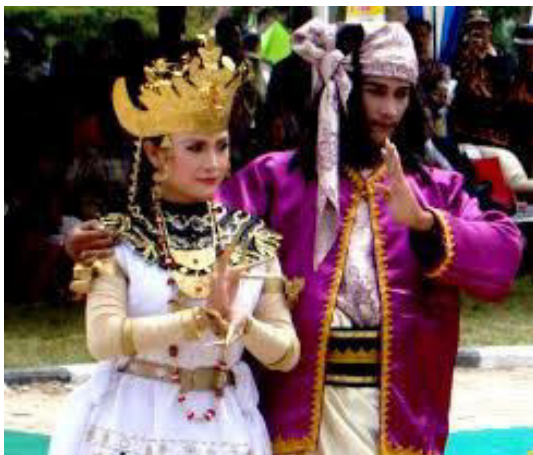
Gambar: Ilustrasi Radin Jambat dalam Festival Radin Jambat di Kabupaten Way kanan

Legenda merupakan salah satu jenis karya sastra lama, yang keberadaannya semakin ditinggalkan masyarakat. Khususnya legenda Radin Djambat dipandang perlu untuk dijadikan bahan kajian dengan harapan dapat memahami nilai-nilai filosofi yang terkandung di dalamnya. Meskipun legenda Radin Djambat ini bersifat fiksi, isi ceritanya menyajikan objek dan menimbulkan daya khayal atau pengalaman melalui kesan-kesan imajinatif. Di dalamnya juga berisi tentang potret kehidupan manusia, terutama dalam bentuk perjuangan, persahabatan, dan keagamaan.