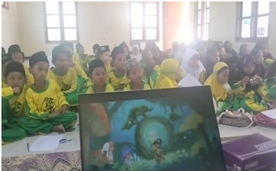
Gambar 1. Suasana menonton bersama

Proses selanjutnya memberikan umpan balik kepada siswa terhadap video animasi yang telah ditonton. Pada sesi ini mendapat respon yang positif dari siswa maupun dari Bapak-Ibu guru. Sebagai penutup kegiatan, dilakukan pengisian angket kepada anak-anak dan guru. Tujuan dari angket ini untuk mengevaluasi kegiatan sekaligus mendapatkan masukan untuk pengembangan animasi. Hasil angket menunjukkan keberterimaan media pembelajaran dengan minor revisi. Dengan demikian, tim berharap akan mampu melanjutkan pembuatan untuk episode berikutnya dengan mempertimbangkan berbagai masukan tersebut.