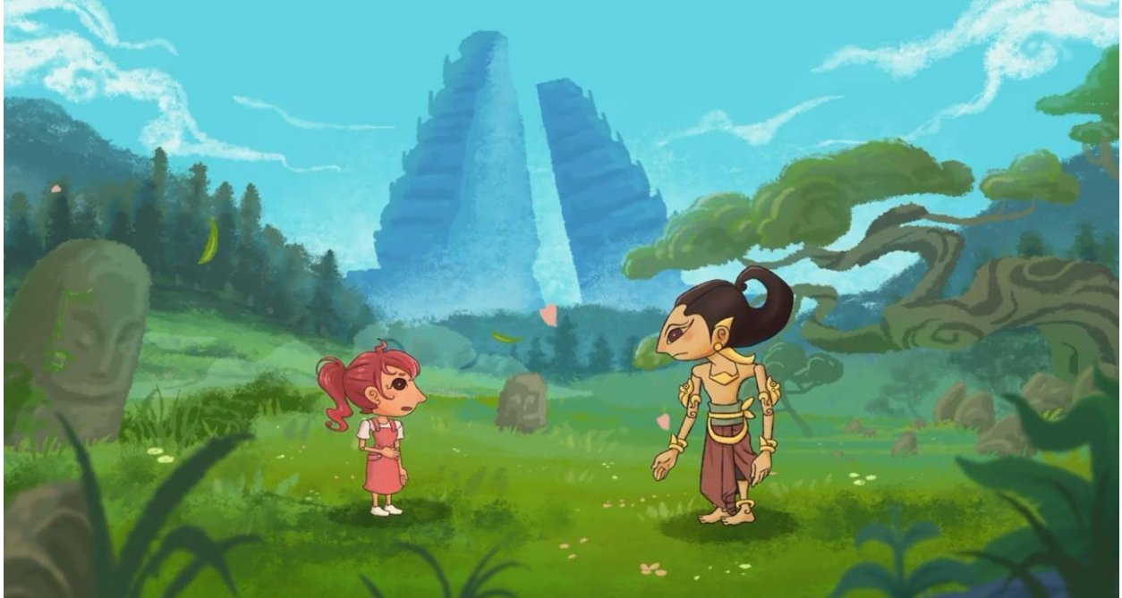
Gambar 2. Animasi didistribusikan secara luas melalui YouTube Ayu lan Bagus Kelir Pandawa part 1

Desain karakter para tokoh menggunakan gaya kartun tanpa garis yang terlihat lucu dengan anatomi yang disederhanakan. Dibubuhkan elemen budaya tradisi pada bagian bentuk mata seperti yang mengambil corak hiasan pada mata wayang kulit. Palet warna yang digunakan cenderung full color dan bernuansa hangat untuk mendukung cerita yang ceria.