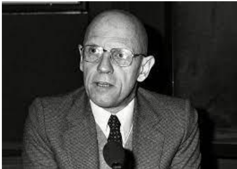
Gambar 2. Michael Foucault

Kekuasaan adalah sebuah dimensi relasi, menurut Michael Foucault, seorang filosof yang mempelopori strukturalisme. Ada kekuatan ketika ada hubungan. Menurut Foucault, kekuasaan ada dimana-mana. Hasrat akan kebenaran identik dengan hasrat akan kekuasaan. Namun, penting untuk ditekankan bahwa konsepsi kekuasaan Foucault secara fundamental berbeda dari apa yang telah dipahami masyarakat sebelumnya. Secara umum, kekuasaan didefinisikan sebagai kemampuan seseorang atau suatu lembaga untuk memaksakan kehendaknya kepada orang lain melalui otoritas atau pengaruhnya. Foucault mengambil pendekatan yang berbeda untuk memahami kekuasaan. Pendekatan Foucault terhadap kekuasaan adalah terobosan. Kekuasaan, menurut Foucault, tidak dipegang atau dijalankan dalam konteks di mana banyak posisi terikat secara strategis satu sama lain. Dalam skala terkecil, Foucault mengkaji lebih banyak kekuatan dalam diri individu sebagai subjek. Karena kekuasaan didistribusikan ke seluruh masyarakat tanpa terlokalisasi. Dalam ranah pengetahuan, ilmu pengetahuan, dan institusi, kekuasaan itu beroperasi dan tidak dipegang oleh siapa pun. Sifatnya menormalkan tatanan masyarakat.