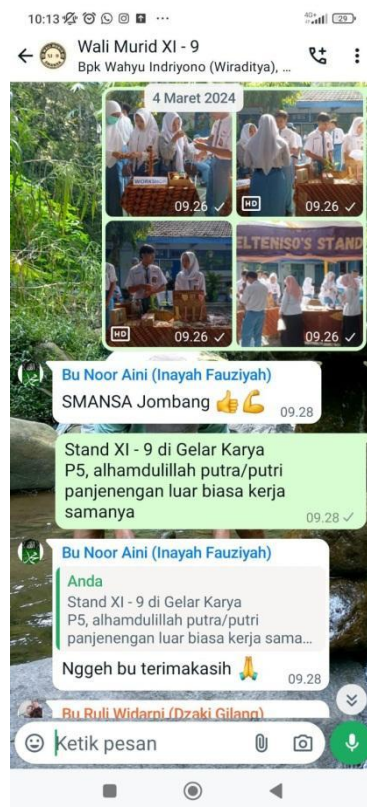
Gambar 2. Dokumentasi Hasil Penelitian Terkait Transparansi Informasi dari Wali Kelas Kepada Orang Tua Siswa

Hasil tes diagnostik yang berupa data potensi yang dimiliki masing-masing siswa tersebut juga akan menjadi acuan untuk penjurusan siswa. Dalam tahapannya, guru BK akan terlebih dahulu memetakan potensi siswa yang setelah itu akan dijelaskan kepada guru atau wali kelas dari para siswa. Setelah dipahami oleh guru atau wali kelas, nantinya informasi mengenai hasil tes diagnostik tersebut akan diinformasikan kepada orang tua siswa. Hal itu juga dibuktikan dengan adanya komunikasi antara wali kelas dengan orang tua siswa melalui salah satu media sosial yaitu WhatsApp yang beranggotakan wali kelas dan para orang tua siswa. Dalam grup tersebut berisikan berbagai transparansi informasi yang disampaikan oleh guru kepada seluruh orang tua siswa mengenai kegiatan yang dilakukan para siswa selama di sekolah dan juga pemberian informasi terkait keperluan administrasi sekolah ataupun kebijakan-kebijakan terbaru yang diterapkan sekolah.